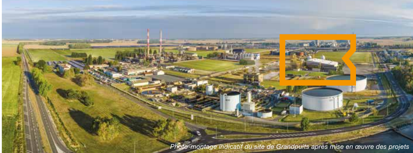
Photo-montage indicatif du site de Grandpuits après mise en œuvre des projets