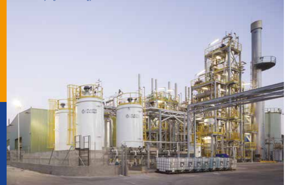
L'usine de recyclage Plastic Energy à Séville

Le coût est estimé à 57 millions d'euros , financés sur fonds propres par Total et Plastic Energy.