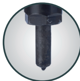
Einspritzdüse ohne Einsatz von Excellium Truck Diesel