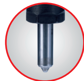
Saubere Einspritzdüse durch Einsatz von Excellium Truck Diesel