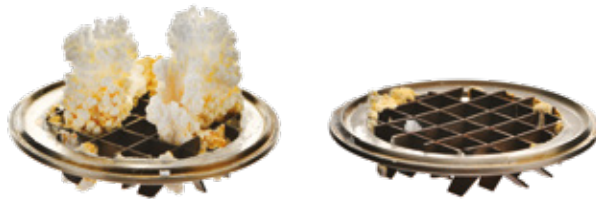
Ohne ClearNOx ®