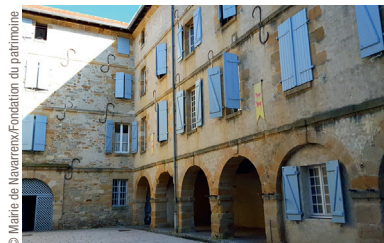
© Mairie de Navarrenx/Fondation du patrimoine