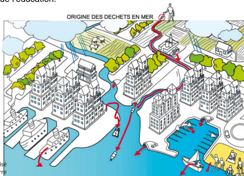
Schéma réalisé par l'association MerTerre

D'ailleurs les déclarations du sommet du G7 du 7 et 8 juin derniers comprennent un plan d'action pour lutter contre les déchets marins qui prévoit notamment dans ses principes généraux : la mise en œuvre de plans de réduction des déchets déversés dans les eaux intérieures et côtières (voués à se transformer en déchets marins) et la sensibilisation du grand public, ainsi que l'éducation.