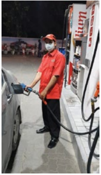
Muhammad Ahsan Sahiwal Filling Station

Two of the recipients of the cash prize incentive expressed how encouraging the idea was: