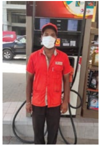
Faisal Red Clay Filling Station

“ I have been working for Total PARCO for over 12 years and over the years, TPPL has always supported us and facilitated us. During the COVID Crisis, TPPL has assisted us by providing masks, gloves and sanitizers which we use thoroughly. We were recently rewarded for selling Excellium to our customers and this has really uplifted our spirits and has encouraged us to perform better. We are always trying our best to provide quality service to customers no matter what the circumstances are. I would urge all of you to not be scared of the current COVID Crisis, but fight it with resilience. ”