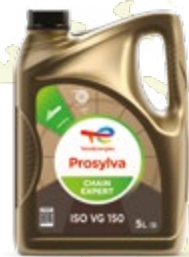
Prosylva Chain Expert