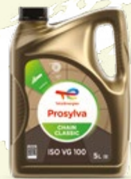
Prosylva Chain Classic

La scelta migliore per la tua motosega e le tue macchine a movimento rapido