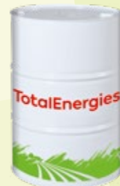
Prosylva Chain Extrem